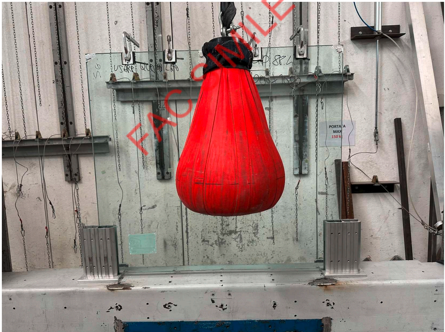
Fotografia dell'oggetto dopo l'urto al centro del parapetto