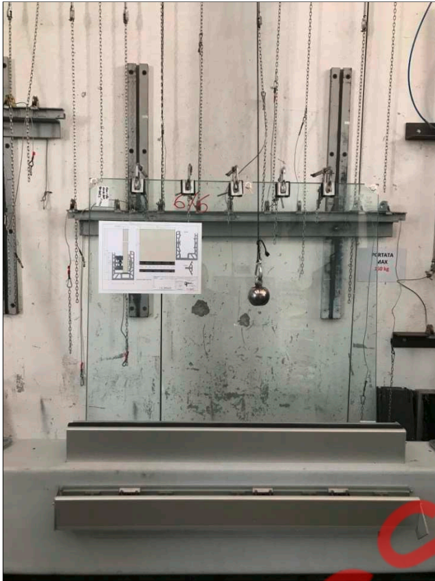
Fotografia dell'oggetto dopo l'urto con corpo duro al centro del tamponamento