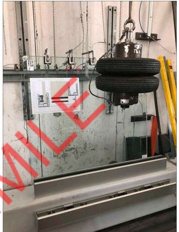
Fotografia dell'oggetto dopo l'urto con corpo semirigido al bordo del tamponamento