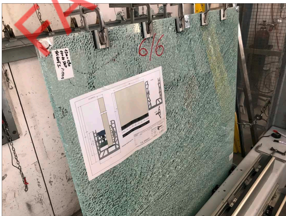
Fotografia dell'oggetto sottoposto a carico post-rottura