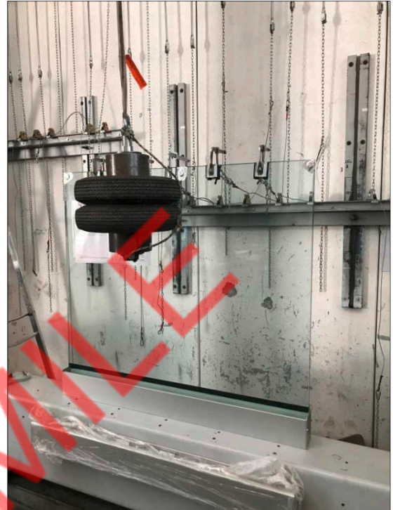
Fotografia dell'oggetto dopo l'urto con corpo semirigido al bordo del tamponamento