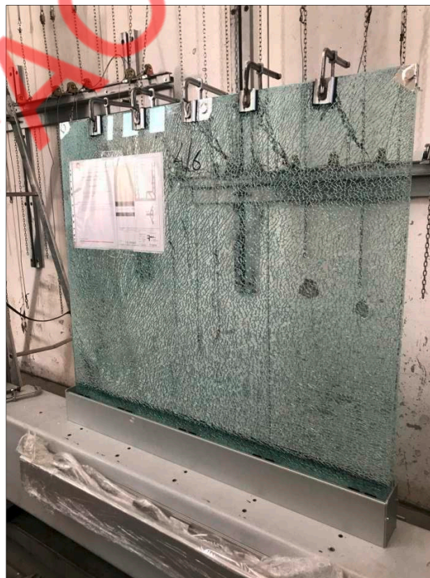
Fotografia dell'oggetto sottoposto a carico post-rottura