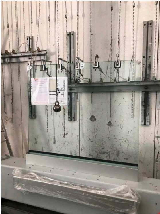
Fotografia dell'oggetto dopo l'urto con corpo duro al centro del tamponamento