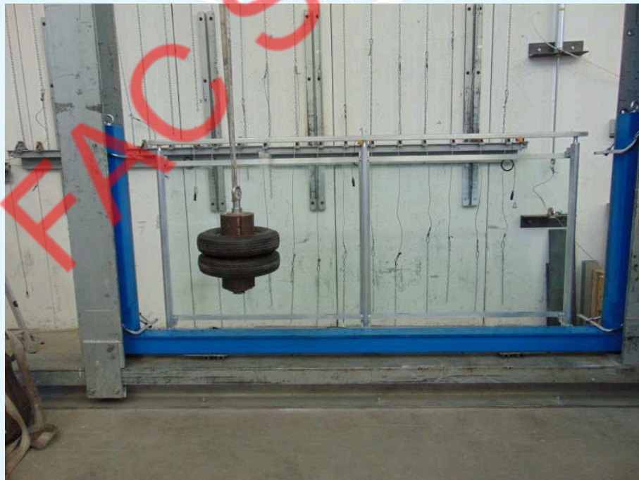
Fotografia del campione dopo l'urto.