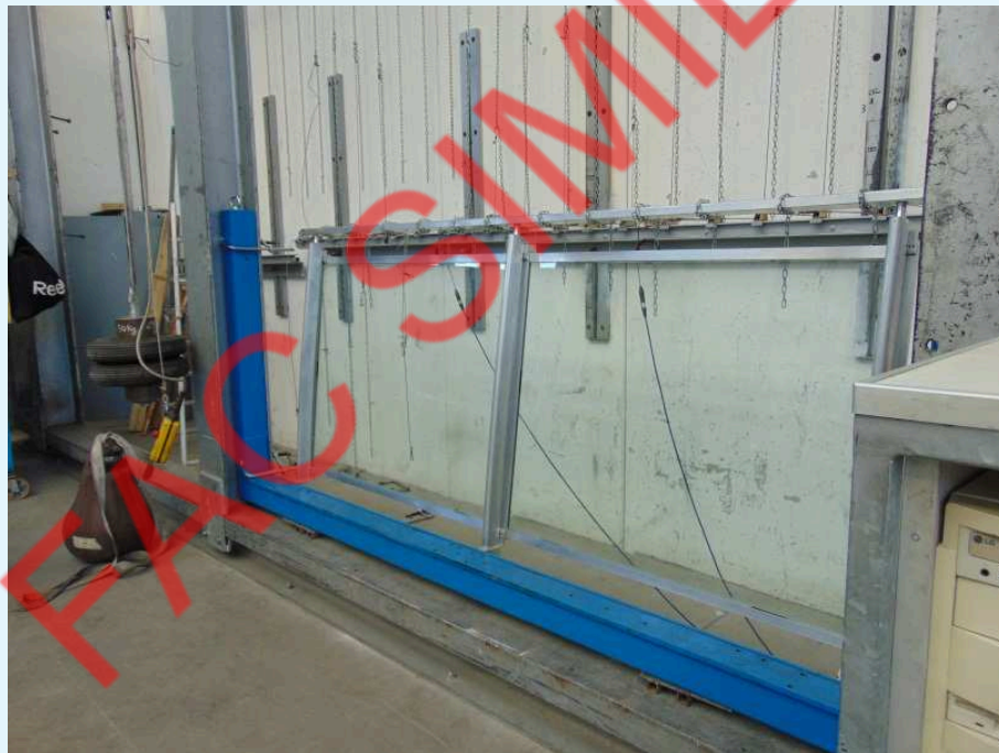
Fotografia del campione sottoposto a carico statico lineare orizzontale.