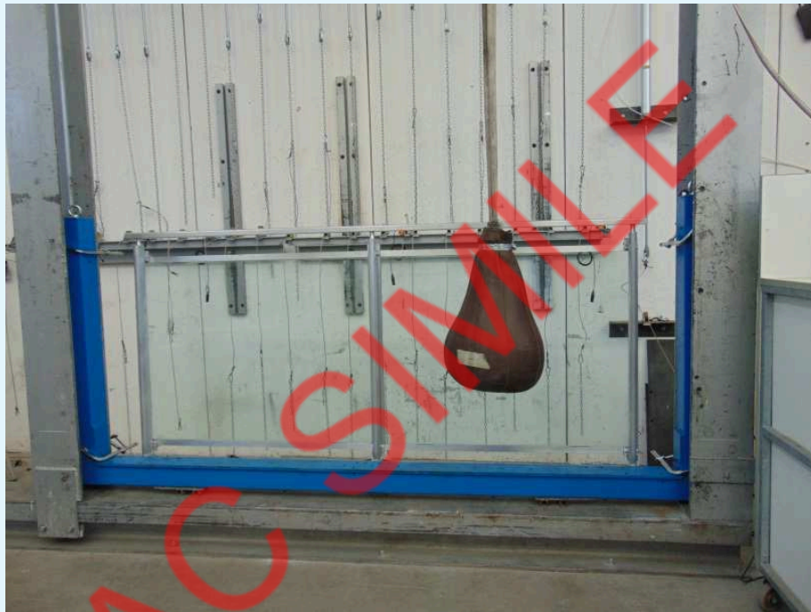
Fotografia del campione dopo l'urto al centro del tamponamento.