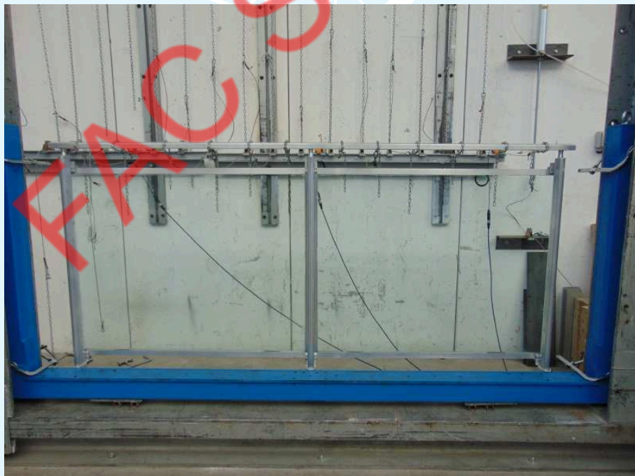
Fotografia del campione.

Per ulteriori dettagli sulle caratteristiche del campione si rimanda ai disegni schematici forniti dal Committente e riportati nell'allegato "A" al presente rapporto di prova.